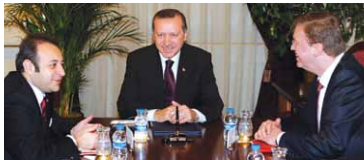
Recep Tayyip Erdoğan miniszterelnök és Egemen Bağış az Európai Unió ügyekért felelős miniszter és főtárgyaló, valamint Štefan Füle az Európai Bizottság bővítésért és az Európai szomszédságpolitikáért felelős biztos.

Mint a Nyugat legkeletibb része és mint a Kelet legnyugatibb része, Törökország egyedülálló stratégiai helyzetet élvez régiójában földrajzi, kulturális és történelmi szempontból egyaránt. Aktív szereplő és hitelt érdemlő közvetítő olyan kritikus területeken, mint amilyen a Közel-Kelet, a Dél-Kaukázus, Közép-Ázsia, a Fekete-tenger, a Földközi-tenger, és a Balkán.