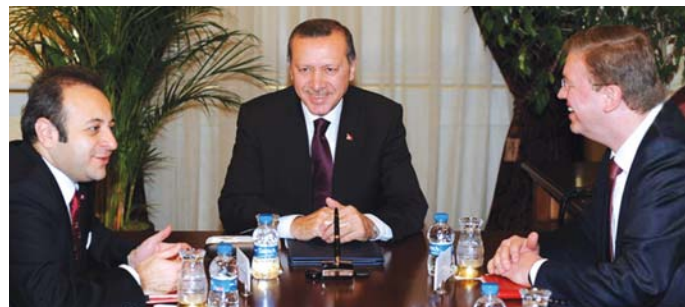
Il Primo Ministro Recep Tayyip Erdoğan e il Ministro per gli Affari dell'Unione Europea e Capo Negoziatore Egemem Bağış con il Commissario Europeo per l'Allargamento e la Politica Europea di Vicinato Štefan Füle.

• Come parte più orientale dell'Occidente e parte più occidentale d'Oriente, la Turchia gode di una posizione strategica unica nella sua regione per motivi geografici, culturali e storici. Si tratta di un protagonista attivo e un affidabile mediatore/moderatore nelle aree critiche come il Medio Oriente, il Caucaso meridionale, l'Asia centrale, il bacino del Mar Nero, il Mediterraneo ed i Balcani.