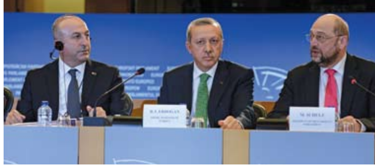
Başbakan Recep Tayyip Erdoğan ile Avrupa Birliği Bakanı ve Başmüzakereci Mevlüt Çavuşoğlu, Avrupa Parlamentosu Başkanı Martin Schulz ile birlikte

• Batı'nın en doğusunda ve Doğu'nun en batısında yer alan Türkiye, kendi bölgesinde, coğrafi, kültürel ve tarihi unsurlar sayesinde eşsiz bir stratejik konuma sahiptir. Türkiye, Orta Doğu, Güney Kafkasya, Orta Asya, Karadeniz havzası, Akdeniz ve Balkanlar gibi kritik bölgelerde etkin bir aktör ve güvenilir bir arabulucu/kolaylaştırıcı konumdadır.