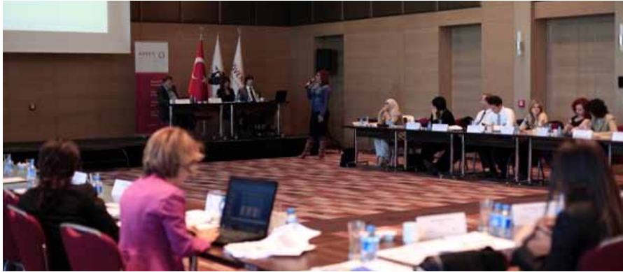
MATRA-PATROL Programı kapsamında gerçekleştirilen "Mevzuat Uyumlaştırma Süreci Hakkında Yuvarlak Masa Toplantısı" (7 Kasım 2014)

Ayrıca, 2013-2014 yıllarında Hollanda'nın Lahey kentinde 3 defa düzenlenen "Mevzuatın Kalitesi, Yürürlüğe Konması ve Uygulanması" konulu MATRA PATROL eğitiminin devamı niteliğinde bir yuvarlak masa toplantısı 7 Kasım 2014 tarihinde Bakanlığımız tarafından Ankara'da gerçekleştirilmiştir.