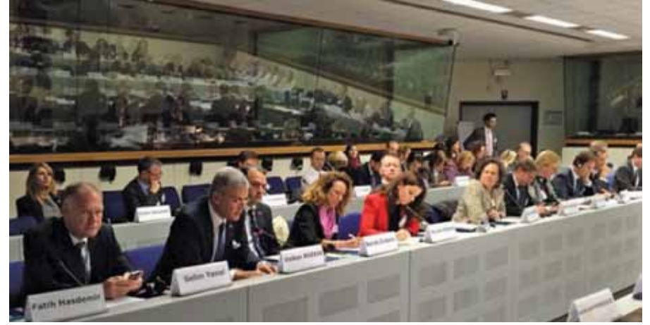
Avrupa Birliği Bakanı ve Başmüzakereci Büyükelçi Sayın Volkan Bozkır'ın Brüksel'de düzenlenen "Genişleme Sürecinde Kamu Yönetimi Reformunun Güçlendirilmesi" konulu konferansta yaptığı konuşma (12 Kasım 2014)

Söz konusu prensipler çerçevesinde 6 reform alanı belirlenmiştir. Bu alanlar; kamu yönetimi reformuna yönelik stratejik çerçeve oluşturulması, politika geliştirme ve eşgüdüm, kamu hizmeti ve insan kaynakları yönetimi, hesap verebilirlik, hizmet sunumu ve kamu mali yönetimidir. Bahsi geçen prensipler ve reform alanları, 1 Aralık 2014 tarihinde Ankara'da düzenlenen "Kamu Yönetimi Prensipleri" konulu konferansta kamu kurum ve kuruluşlarımıza anlatılmıştır. OECD-SIGMA ile Bakanlığımız ev sahipliğinde gerçekleştirilen konferansın açılış konuşması, Avrupa Birliği Bakanlığı Müsteşarı Büyükelçi Sayın Rauf Engin Soysal tarafından yapılmıştır.