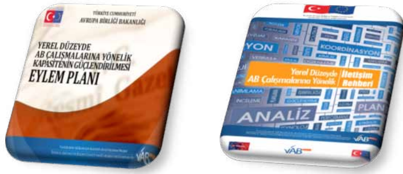
Yerel Düzeyde AB Çalışmalarına Yönelik Kapasitenin Güçlendirilmesi Eylem Planı ve Yerel Düzeyde AB Çalışmalarına Yönelik İletişim Rehberi

Eylem Planı'na ek olarak yine bu dönem içerisinde "Yerel Düzeyde AB Çalışmalarına Yönelik Kapasitenin Güçlendirilmesi Eylem Planı'nın eki olan "İletişim Rehberi" hazırlanarak yerel aktörlerle paylaşılmıştır. Eylem Planı'nın eki mahiyetinde olan "İletişim Rehberi", Avrupa Birliği Bakanlığı'nın 2014 Eylül ayında yayımladığı "Avrupa Birliği İletişim Stratejisi"nin (ABİS) yerele yönelik bir alt aracıdır.