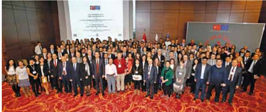
Sivil Toplum Diyaloğu Projesi Hibe Uygulama Eğitimi ve Açılış Etkinliği