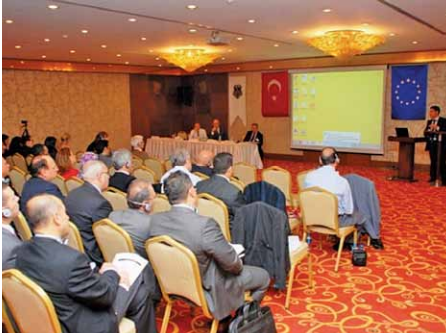
Adalet Bakanlığı Ceza ve Tevkif Evleri Genel Müdürlüğü'nün faydalanıcısı olduğu "Cezaevi Kapasite Yönetimi Çalıştayı" (19-20 Kasım 2014)

TAIEX kapsamında son 6 ayda; 21 çalıştay, 28 çalışma ziyareti, 11 uzman talebi ve 13 çok ölkeli çalıştay gerçekleştirilmiş olup, bu faaliyetlere ülkemizi temsilen 1834 kamu görevlisi katılmıştır.