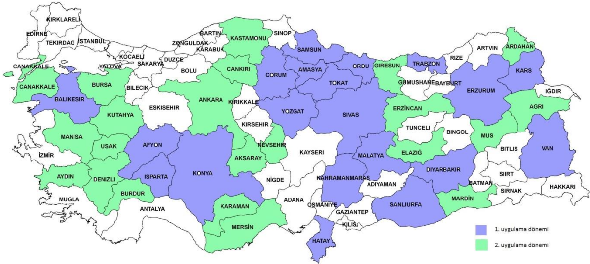
Harita: IPARD Programının uygulandığı iller