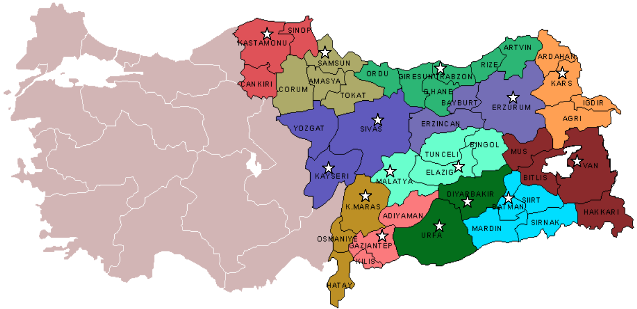
Harita 1: Uygun 12 Düzey II Bölgesi ve 15 Büyüme Merkezi (Beyaz yıldızlar Büyüme Merkezlerini göstermektedir)

Diğer yandan, sektörel yoğunlaşma anlamında Program; imalat sanayi ve turizm KOBİ'leri ile bilgi toplumu, araştırma, geliştirme ve inovasyon sektörleri üzerine odaklanmaktadır.